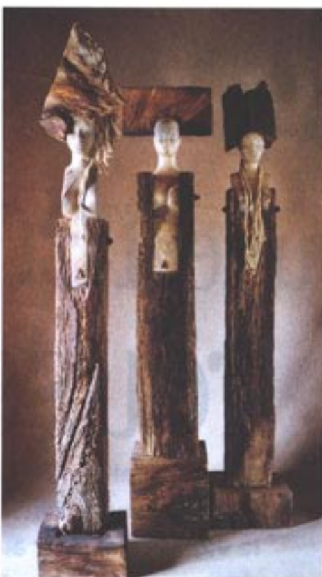
"Tinaïdes" marbre, bois, fer.

Patrick Vogel - Sculpteur. Le Moulin d'iches 46250 Cazals. Tél. 05 65 22 86 18. Ouvert tous les jours de 9 h à 12 h et de 14 h à 19 h. 80 m 2 d'exposition. www.p-vogel.com