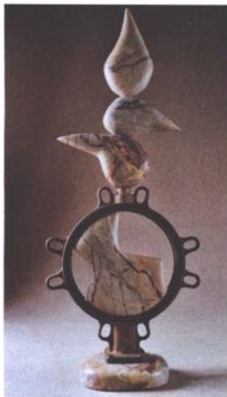
"Phanérogamaïdes" marbre et fer.