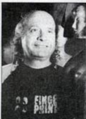
L'artiste au milieu de ses œuvres